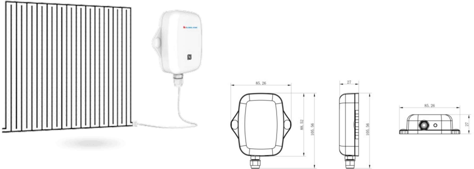
Patch type water immersion sensor | Dimensions